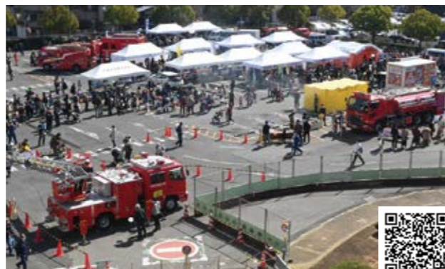
戸田市消防・防災フェア

議員 災害から家族や自分の「命」を守るためには、自助・共助・公助の「共助」を担う「自主防災会（町会・自治会）への参加が不可欠」であることを市民に、特にマンションにお住まいの方に強くお伝えいただきたい。加えて、昨年的一般質問で採り上げ、実現した「防犯・防災・災害」情報を集めたホームページの周知も、市民の命を救うために推し進めてほしい。