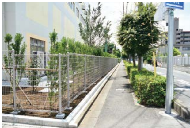
戸一小西側侵入防止柵

教育部長 メッシュフェンスを設置し、すり抜けや乗り越えを防ぐ。オートロック等については、美笹中学校での実証を踏まえて早めに取り組む。